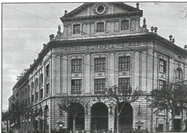
El Teatre Circ Español