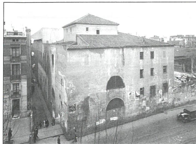
La presó d'Amàlia o Presó vella, cap els anys 30

En els terrenys on avui se situa la plaça Folch i Torres i l'IES Milà i Fontanals, antiga seu del convent de frares paüls, es va erigir l'any 1838 la presó, on es traslladà homes, dones i criatures des dels nou anys, perquè funcionava com a correccional. La presó que en principi estava destinada a albergar a unes 400 persones, va arribar a tenir al voltant de 900 interns. Albergava als qui estaven pendent de judici o bé a aquelles persones que complien penes de pocs dies (quincenaris) o mesos, confonent-se assassins i pinxos confessos amb joves i nens lladres de menjar o de roba, nens sense llar, dones acusades de furt, prostitució o avortament. Convertint-se en l'amuntegament, la violència, el pessim menjar, la falta d'aigua, les plagues d'insectes en els pitjors càstigs que patien els presos interns. Excepte els quals podien pagar-se allotjaments individuals o compartits amb menys persones. La majoria dels funcionaris i excepte rares excepcions,