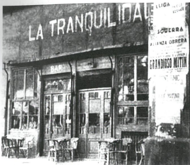
El bar La Tranquilidad, l'any 1934

Qual el governador tancava el bar, la clientela es reunia al Bar Chicago, a la vorera contrària del Paral·lel, cantonada amb la Ronda st. Pau, o també al Bar Rosales. Aquests tres locals, al voltant de la Bretxa de st. Pau, aplegaven la militància anarquista.