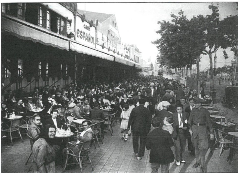
Gran Cafè Espanyol del Paral·lel

El Cafè fou fragmentat en diversos locals el 1948.