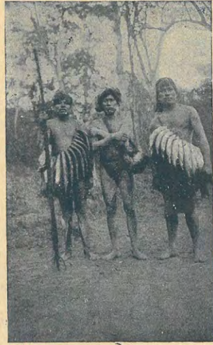
INDÍGENAS DEL CHACO BRAZILERO

En sus diferentes fases el culto al desnudo se practica en todas partes del globo.