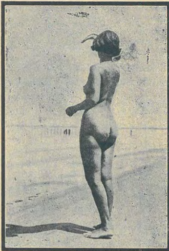
La libertad corporal también agrada a esta niña de Suecia