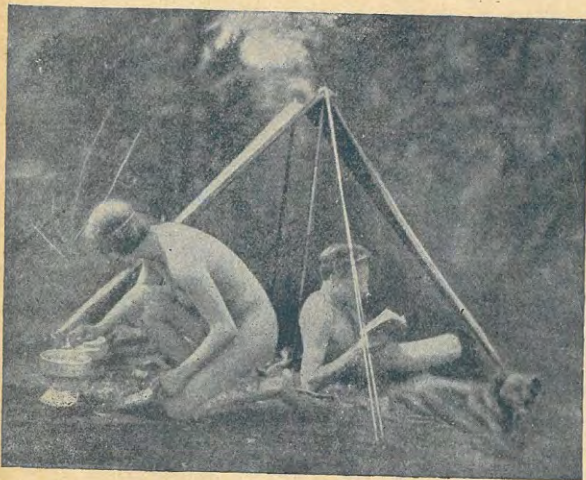
Preparando la ensalada de frutas