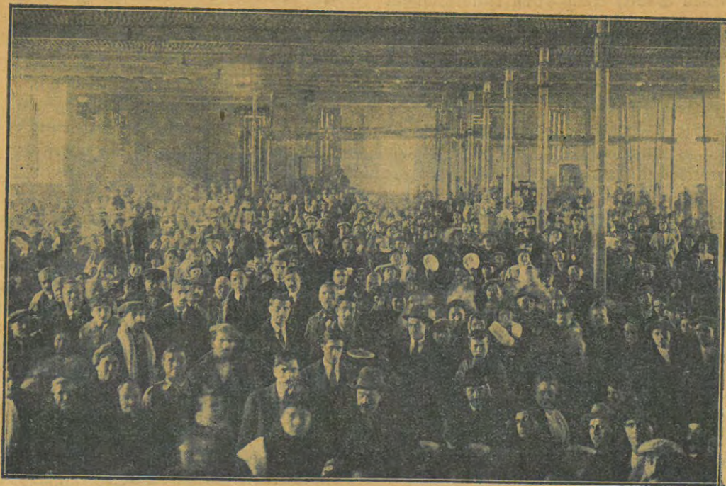
Artés. Celebrant la coberta de la Fàbrica Nova.

sesió dels seus carrecs les autoritats populars elegides en el memorable plebiscit del Novembre passat; els artesencs desitjaven amb follia reunir-se en fraternal aplec ont els cors, bategant al unison de la comú aspiració de justícia i llibertat, fruïssen amb